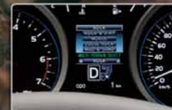
5-mode Multi-terrain Select with Monitor