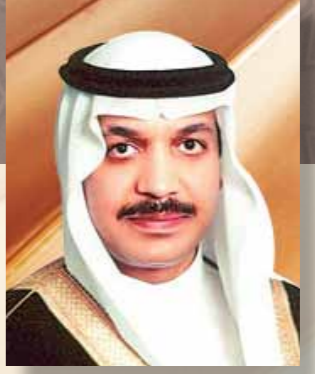
د/ عبدالمحسن بن فهد المارك بقلم / سفير خادم الحرمين الشريفين لدى مملكة البحرين