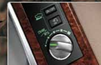
CRAWL Control with World 1st Turn Assist Function