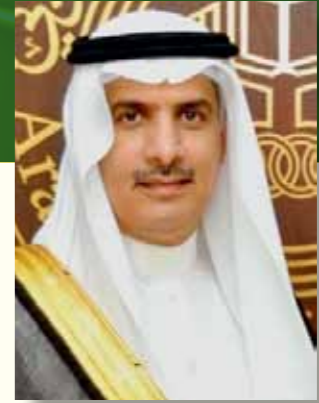
بقلم /الدكتور خالد بن عبدالرحمن العوهلي رئيس جامعة الخليج العربي