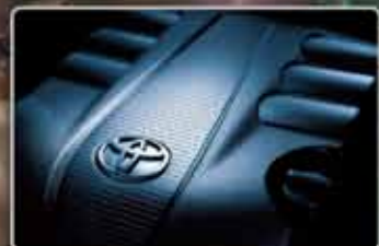
New Engine 4.6L, V8 308HP Developed Engine 4.0L, V6 271HP

The New 2012 Land Cruiser takes refined elegance, rugged luxury and supreme power to totally new dimensions. It has a newly redesigned futuristic exterior, an ultra-luxurious cabin equipped with innovative features and on top of that extra powerful yet more fuel efficient engines.