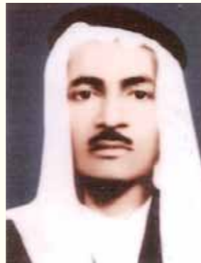
المجاهد والمؤرخ الأستاذ فهد المارك رحمه الله

في مبادرة استحققت التقدير والثناء، وعرفانا بالدور البطولي للقائد المجاهد والأديب السعودي فهد المارك - رحمه الله - أطلق الفلسطينيون اسم بطل حرب (٤٨) السعودي فهد المارك على مدخل مدينة طولكرم الجنوبي تقديراً لشجاعته في قيادة الفوج السعودي الذي قاتل الإسرائيليين قبل أكثر من (٦٠) عاماً، ليأخذ الشارع اسم (شارع المناضل السعودي فهد المارك).