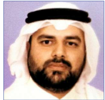
إعداد: أحمد ناصر السليمي رئيس شعبة العلاقات العامة وزارة الداخلية

المواجهة المجتمعية لأي ظاهرة خطيرة أو جريمة ضرورة حتمية من أجل مجابهة حاسمة وفعالة، وعن تطبيق فكرة الشرطة المجتمعية أو نهج المواجهة المجتمعية في مجال مواجهة مشكلة المخدرات، فإنه وإن كان بالغ الأهمية والحيوية في الشق الخاص بخفض الطلب -وهو بالأساس جانب غير شرطي- إلا أن أجهزة مكافحة العرض تسهم فيه وتدعمه بالنظر لأهميته ولأهمية توجيه عناية له بالتوازي لجهود مكافحة العرض. وعلى الجانب الآخر فإن الجهود الشرطية الموجهة لمكافحة العرض إنما تتسم بطبيعة عملية وفنية خاصة لا تتوافق ولا تنسجم مع الشكل المتوقع لنهج الشرطة المجتمعية، فضبط جرائم المخدرات يخضع لإجراءات قانونية شديدة الدقة والحزم لتحقيق أعلى درجات الحفاظ على الحريات واستنباط أدلة الاتهام.